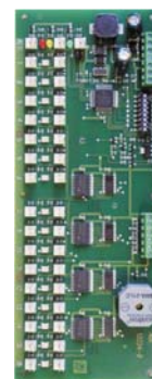
P-BUS LED-Tableau Ansteuerbaugruppe